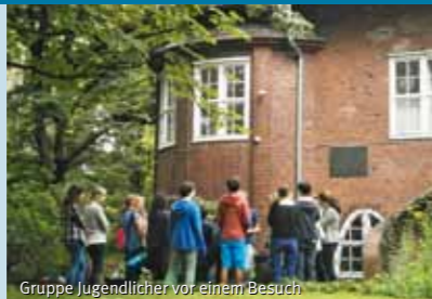
Gruppe Jugendlicher vor einem Besuch