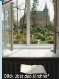
Blick über den Kirchhof